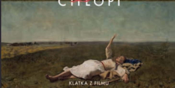
KLATKA Z FILMU