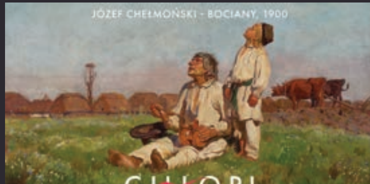
JÓZEF CHELMOŃSKI - BOCIANY, 1900