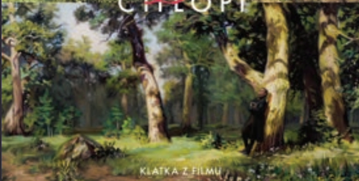
KLATKA Z FILMU