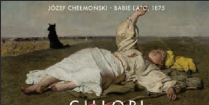
JÓZEF CHELMOŃSKI - BABIE LATO, 1875