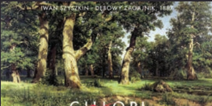
IWAN SZYSZKIN - DĘBOWY ZAGAJNIK, 1887