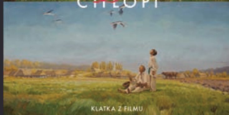
KLATKA Z FILMU